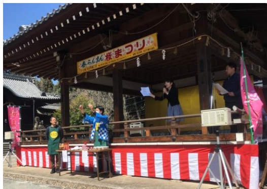
青年部はたこせん販売とともに、クイズ大会を開催