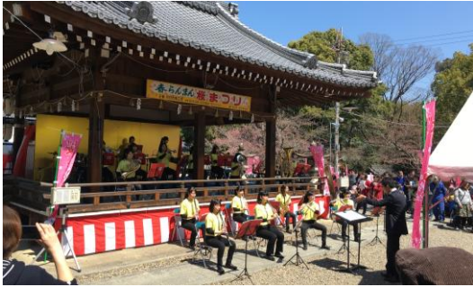
地元高校生によるエネルギッシュな吹奏楽演奏