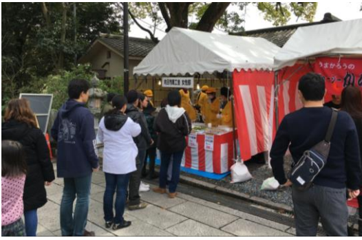
女性部は大人気の「タケノコのてんぷら」を販売